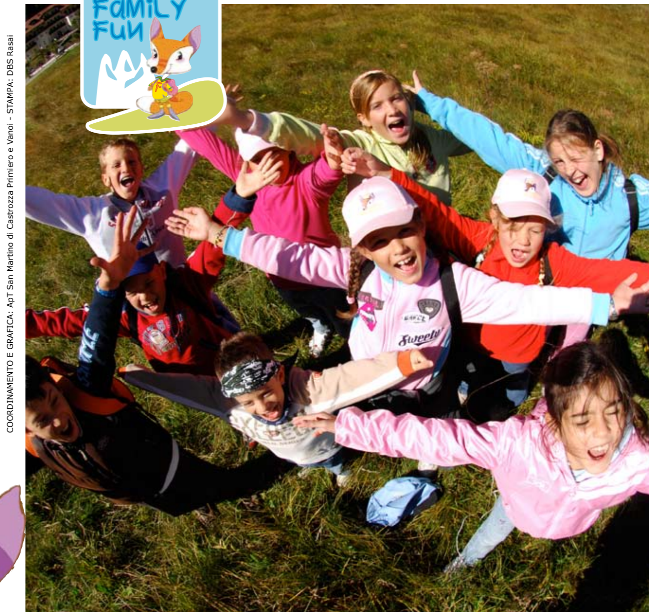
COORDINAMENTO E GRAFICA: Apt San Martino di Castrozza Primiero e Vanoi - STAMPA: DBS Rasai

FANNY ti aspetta la prossima estate con nuovi amici